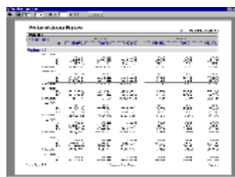
> écran de relatório