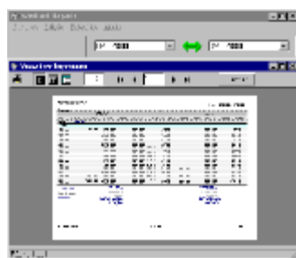
> écran de previsão de relatório

Também recebe informação de qualquer software existente no mercado, após recepção dos layouts do mesmo, ou ainda integrar esses mesmos softwares como gerador de relatórios inteligentes através da tecnologia Plug-In.